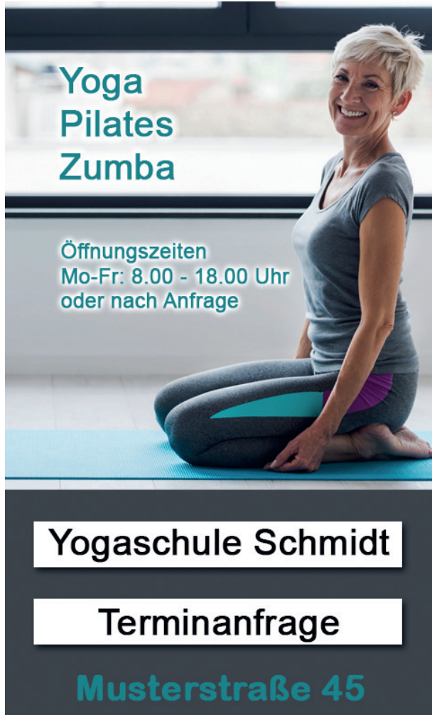
Bild möglichst im Hochformat (Dateiformat jpg, pdf, png oder gif)

HINWEIS: Nicht gewünschte Felder frei lassen. Text bitte in gewünschter Schreibweise (Groß-, Kleinbuchstaben) eintragen.