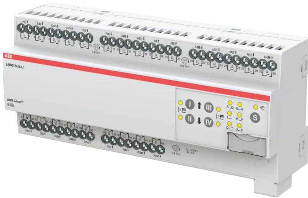
Abb. 1: Geräteabbildung SAH/S 24.6.7.1

Der Schalt-/Jalousieaktor ist ein Reiheneinbaugerät im proM-Design. Das Gerät ist für den Einbau in Elektroverteilern und Kleingehäusen zur Schnellbefestigung auf einer Tragschiene von 35 mm konzipiert (nach DIN EN 60715).