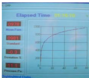
Prüfemperaturkurve nach DIN 4102